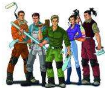
Der Förderverein für den Nachwuchs im bodenlegenden Handwerk e.V. der Uzin Utz AG startet auf facebook.com. mit den „Masters of the Floor“ – fünf neuen Helden des Handwerks.