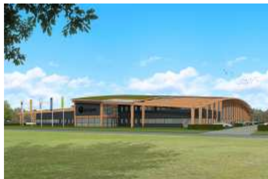
Der Neubau des Firmengebäudes der Uzin Utz-Tochter Unipro in den Niederlanden soll bis Anfang 2014 fertiggestellt sein.