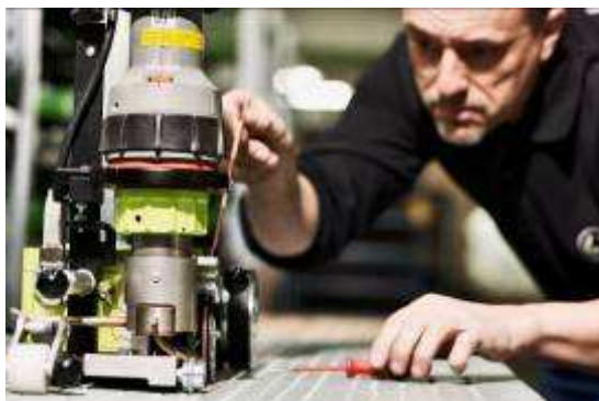
Der Baubeginn einer neuen Produktionsstätte der Firma Wolff am Standort Ilsfeld bei Heilbronn ist für das Frühjahr 2013 geplant.